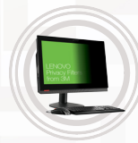
Filtre de confidentialité Lenovo par 3M pour tout-en-un ThinkCentre