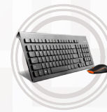
Ensemble clavier et souris sans fil Lenovo Professional