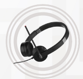
Casque stéréo Lenovo