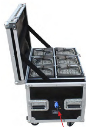
Connecteur de charge